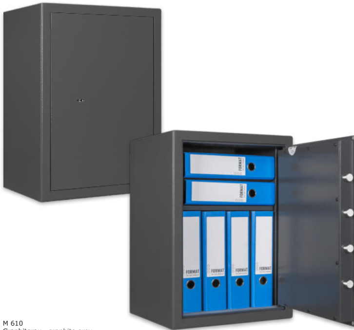
M 610 Graphitgrau • graphite grey Dekoration nicht im Lieferumfang enthalten • decoration not included in the delivery

■ Versicherungssumme nach Absprache mit dem Versicherer