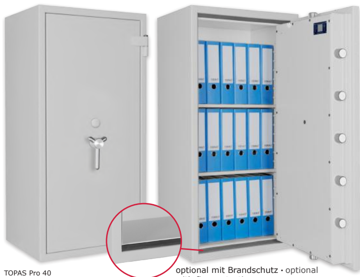
TOPAS Pro 40 Lichtgrau • light grey optional mit Brandschutz • optional with fire protection

Dekoration nicht im Lieferumfang enthalten • decoration not included in the delivery