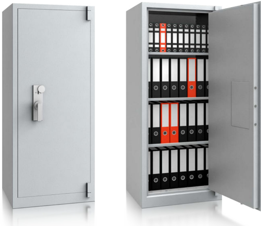
Modell BS 1000