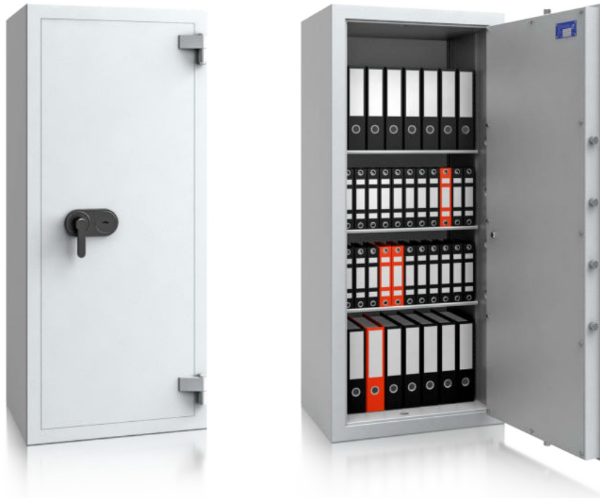
Modell EV I-160