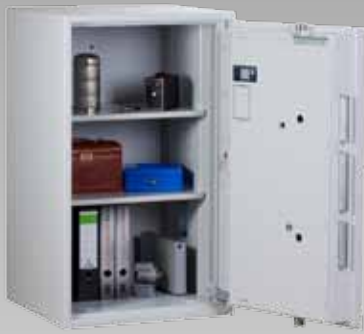
Abb.: EW 3-105