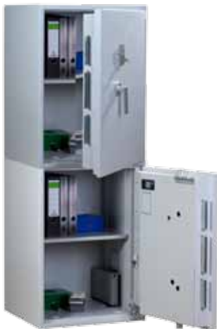
Abb.: EW 3T-163

Auf Anfrage: Zertifizierte Ausführung mit zwei Türen übereinander (Muster siehe unten)