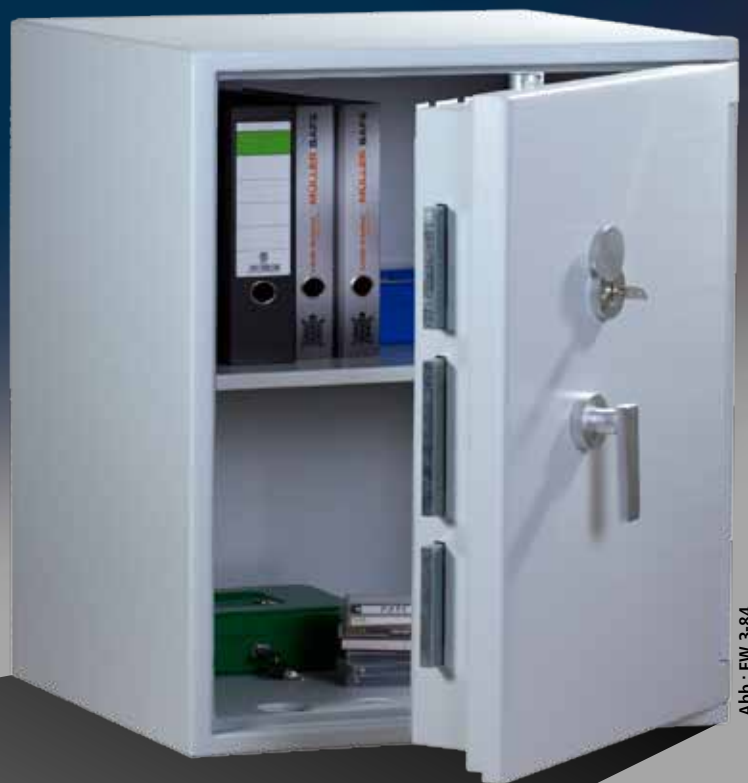
Abb.: EW 3-84