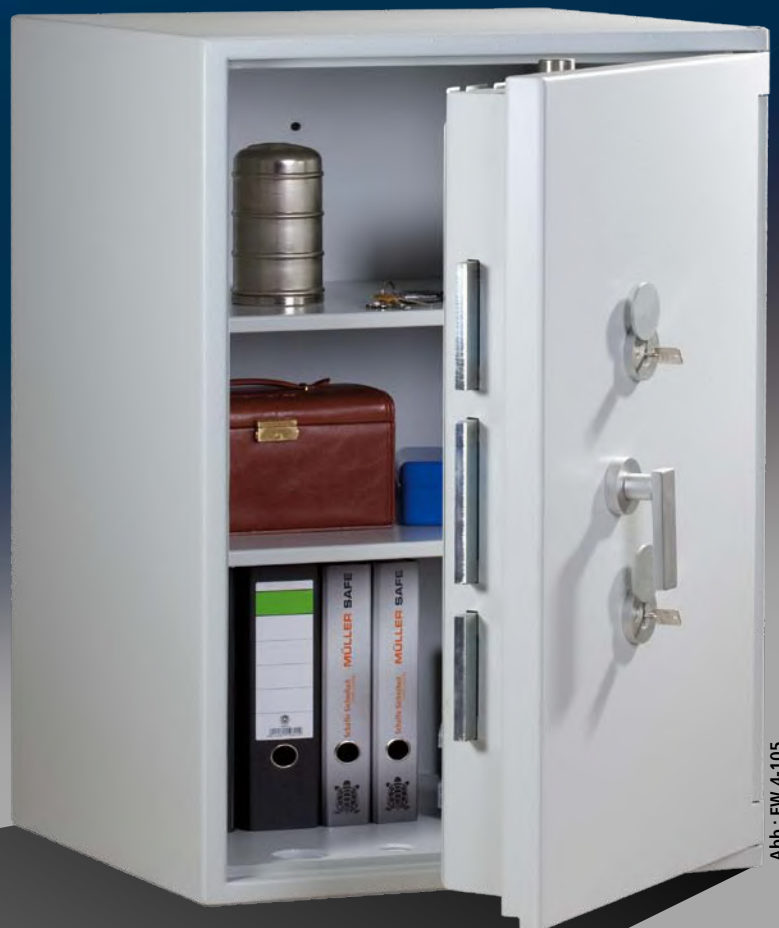
Abb.: EW 4-105