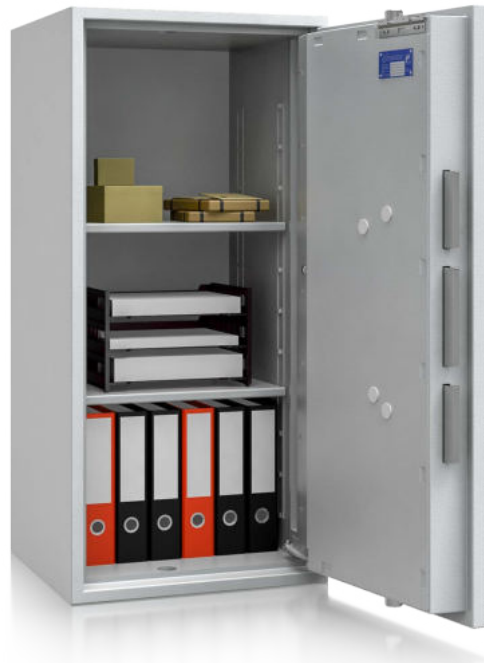
Modell EW IV-120