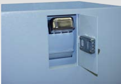
Abb.: GT EW mit Trommeleinwurf