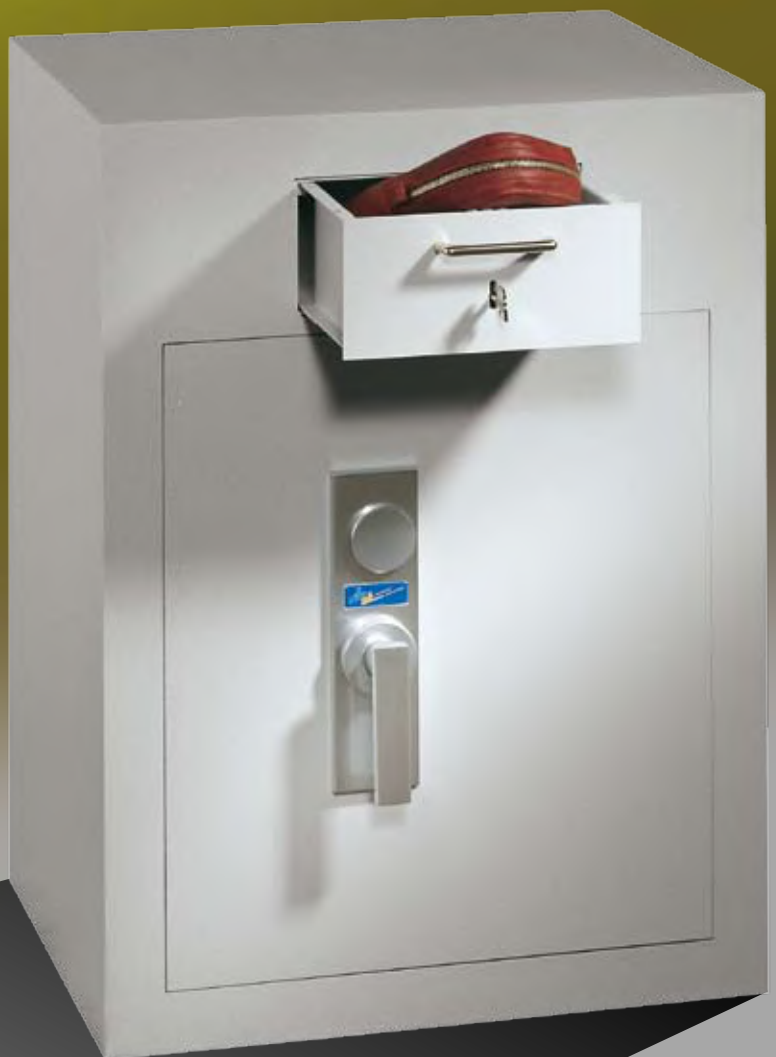
Abb.: GT EW