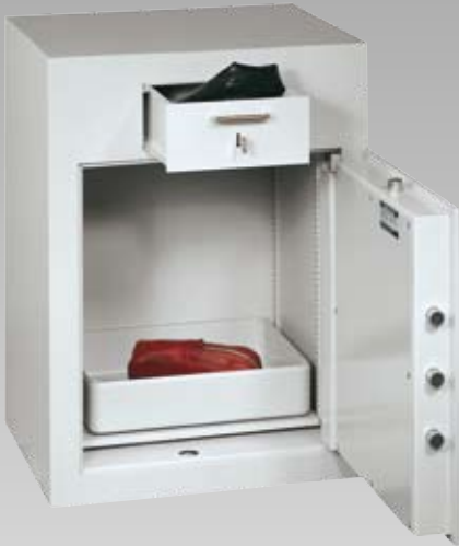
Abb.: GT EW