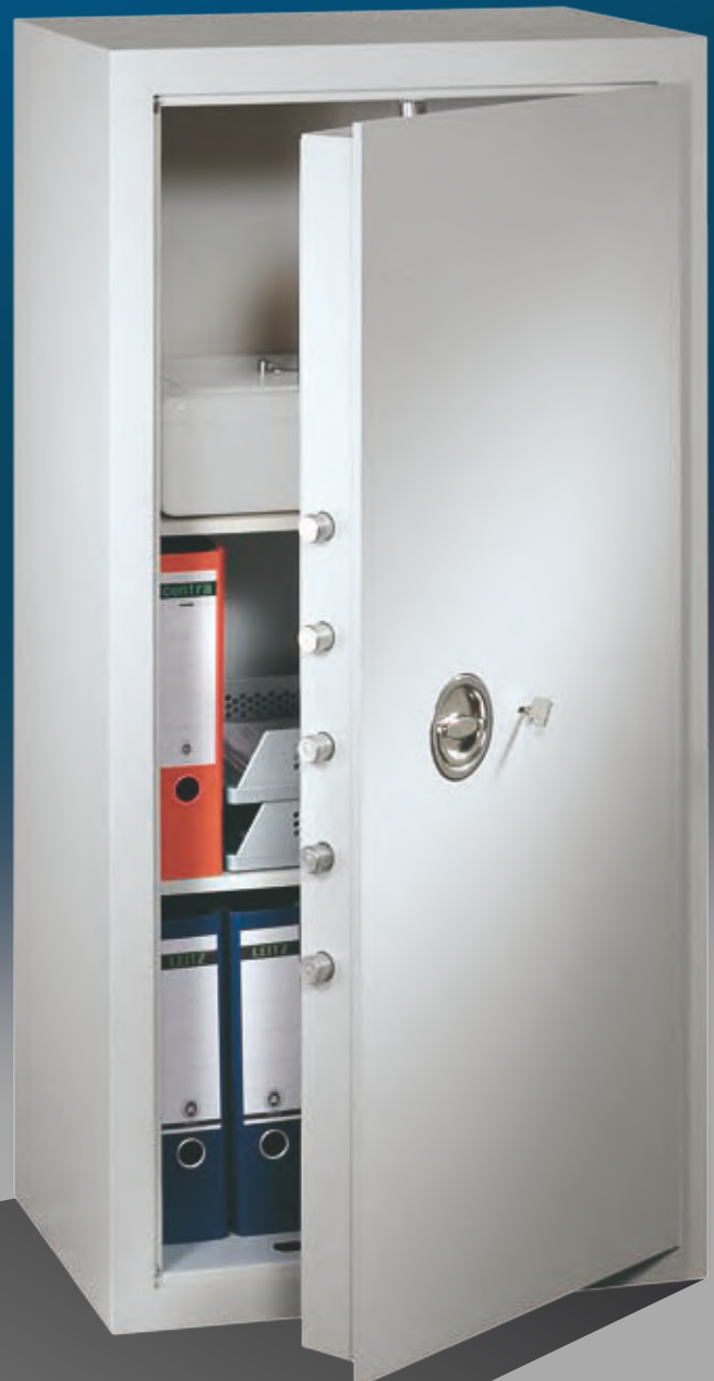
Abb.: MNO 12