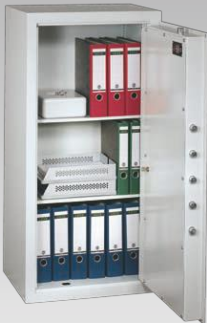
Abb.: MNO 12