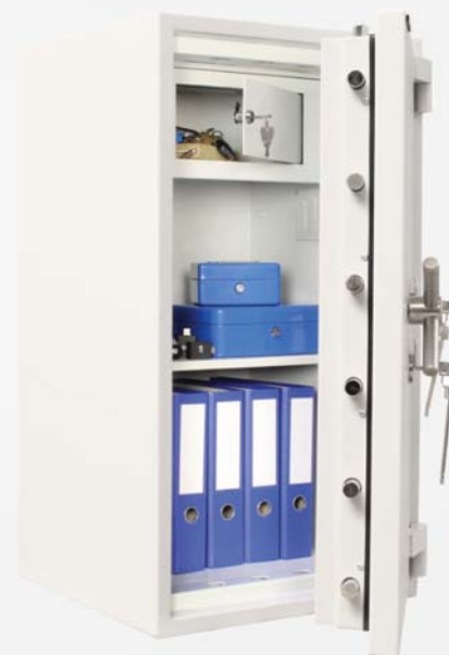
Projekt Fire Premium 100