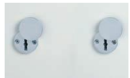
Grundausrüstung: 2 x DSS mit Schlüsselrosette (Standard)