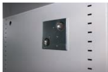
Vorbereitung für eine Alarmkomplettausstattung