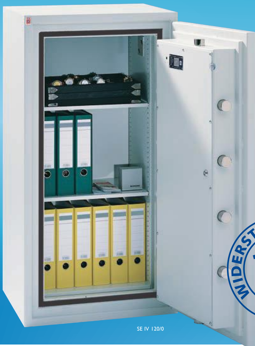
SE IV 120/0